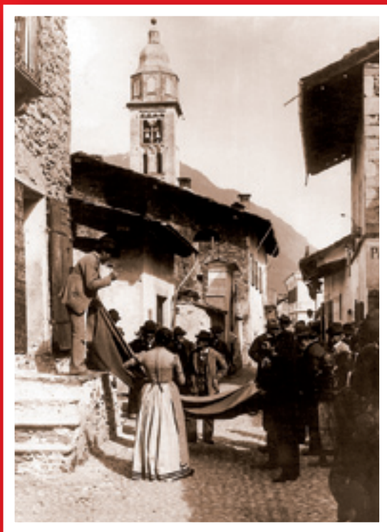
Morgex piazzetta Artari.

È ra il 1886 quando alle pendici del Monte Bianco, a Morgex in Valle d'Aosta, Giuseppe Artari inventa la sua vita. Crea il suo laboratorio del caffè e apre la Bottega dei Sapori convinto che lo splendore delle sue montagne, immortalate dai suoi illustri antenati pittori, avrebbero trasformato nel corso degli anni questa piccola regione alpina in una meta esclusiva del turismo internazionale.